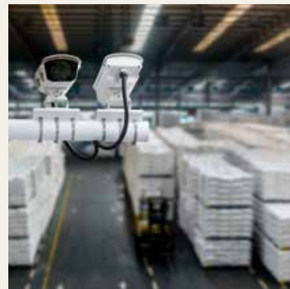
インダストリアル