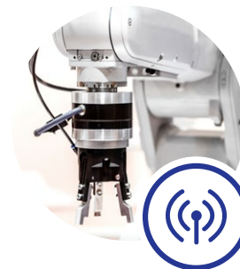
インダストリアル