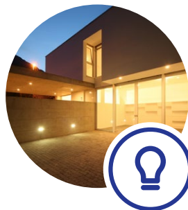
照明管理システム